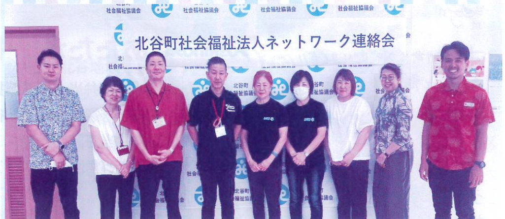
《構成団体の皆さん》