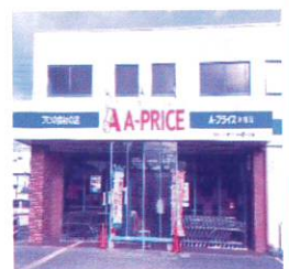
Aプライス沖繩店 (沖繩市山内)