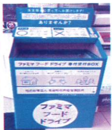
ファミリーマート 5店舗

「食事に困っている方への支援」「家庭の食品ロス削減」を目的とし、株式会社沖繩ファミリーマート、株式会社トーホー沖繩 (Aプライス沖繩店) と「フードドライブに関する合意書」を交わしました。ファミリーマート5店舗 (北谷桃原店、北谷美浜三丁目店、北谷フィッシャリーナ店、北谷北前店、北谷吉原店) はフードドライブ用のBOXを設置しており、Aプライス沖繩店 (沖繩市山内) はお店の方へお声かけをお願いします。皆さまのあたたかいご協力をよろしくお願いします。