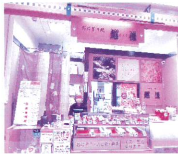
おにぎり処 越後 (イオン北谷店1F)

詳しくは下記のURL、またはQRコードより ご確認ください http://tacoricelovers.com/lp/