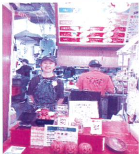
タコライスcafe きじむなあ テポアイランド店