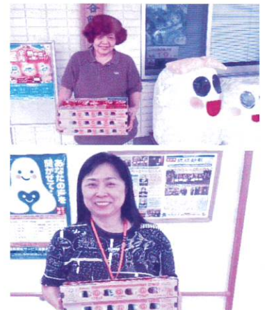
沖縄ヤクルト 株 様より すまいるカフェさん (上) とレインボーさん (下) に お届けしました。