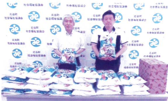
社会福祉法人 美原福社会 様