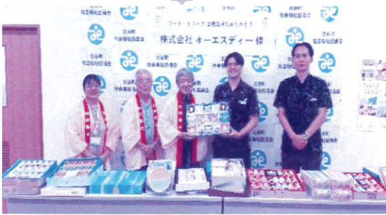
株式会社 オーエスディー 様