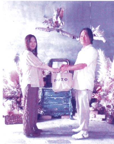
Studio Cocoro スタジオココロ 様