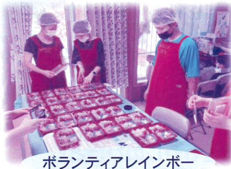
ボランティアレインボー

この体験は子どもの居場所団体との交流や活動内容に理解を深めることを目的とし、町内中高生を対象に、30名が参加、4ヶ所の居場所団体で活動しました。参加者からは「家で作る時よりも大きな鍋でたくさんの量を作るから、想像していたより体力を使うし力仕事だと思った」「ボランティアは大変そうってイメージがあったけど、楽しい雰囲気で行動しているのを見て私も楽しくおにぎりを作ることができた!」と様々な感想や意見があり、この体験を通してたくましくなった皆さんにまわりの大人たちもほっこりでした。たくさんのご参加ありがとうございました。