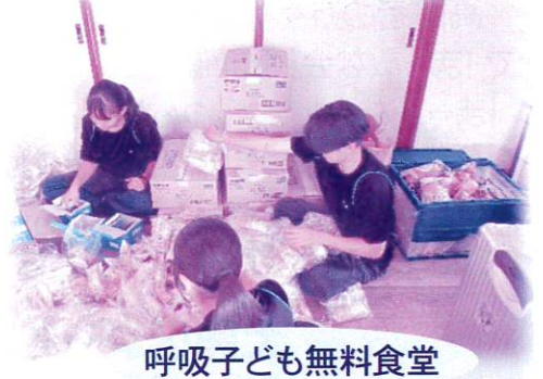
呼吸子ども無料食堂