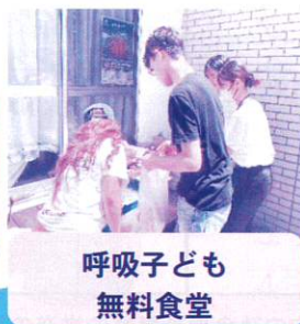
呼吸子ども 無料食堂