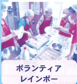
ボランティア レインボー

お米、野菜、肉類、調味料(未開封)、粉ミルク、離乳食、紙おむつ(サイズが合わないなど開封済OK!) ※食品は賞味期限が1ヶ月以上のもの