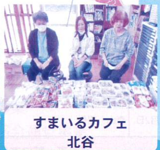
すまいるカフェ 北谷

ご意見、ご要望がございましたらお電話(098-936-2940)までお寄せ下さい