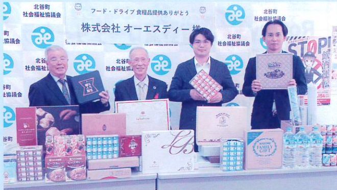
〈 株式会社 オーエスディ 様 〉

今年度も、町内外の事業所、団体、個人の皆様よりたくさんの寄贈品をお寄せいただきました。支援を必要とする世帯へお渡ししています（一部の皆様をご紹介します）