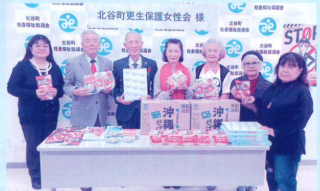
〈 北谷町更生保護女性会 様 〉