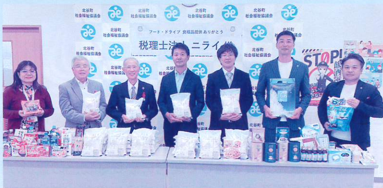
〈 税理士法人 ニライ 様 〉