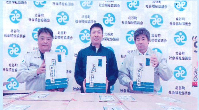
〈 有限会社 万代設備 様 〉