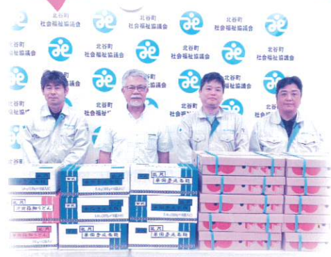
(有) 万代設備 様