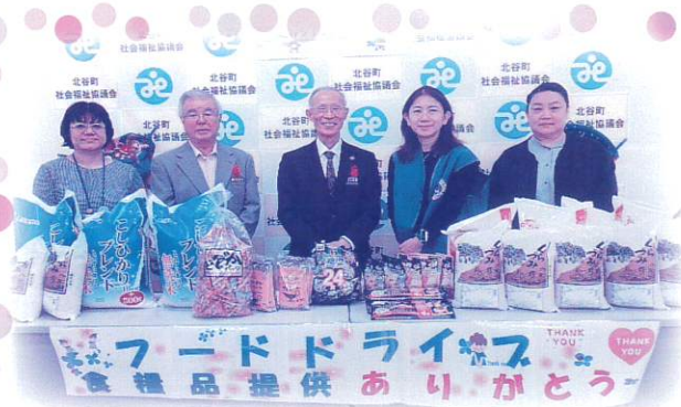
ライオンズクラブ国際協会 337-D 地区 沖縄 R1Z 北谷ライオンズクラブ 様

町内外の事業所、団体、個人の皆様よりたくさんの寄贈品をお寄せいただきました。寄贈品は支援を必要とする世帯へお渡ししています。(一部の皆様をご紹介します。)