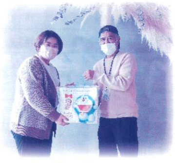
studio Cocoro 子供と家族の写真館 様