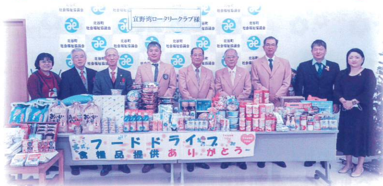
宜野湾ロータリークラブ 様