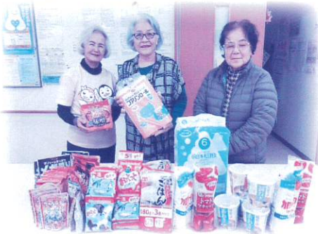
北谷町更生保護女性会 様