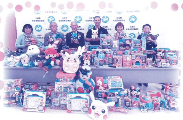
クバサキハイスクール 様