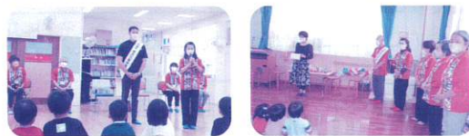
一日民生委員児童委員

「民生委員・児童委員の日」である毎年5月12日から一週間は「活動強化週間」とし、その活動や理解を深めてもらうため、様々なPR活動に取り組んでいます。12日に謝刈保育所、13日にはつぼみっ子保育園を北谷町長や社協会長が一日民生委員児童委員として訪問しました。また町内12カ所に横断幕、各自治会にはのぼりを設置しています。お近くを通る際はぜひご覧になってください。