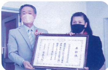
北谷町民生委員 児童委員協議会 様

永年にわたり、共同募金運動に率先して協力され、社会福祉の発展に大きく貢献され受賞されました。