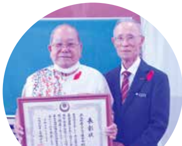
北谷町老人クラブ連合会

永年にわたり共同募金運動に率先して協力され、社会福祉の発展に貢献され受賞されました。