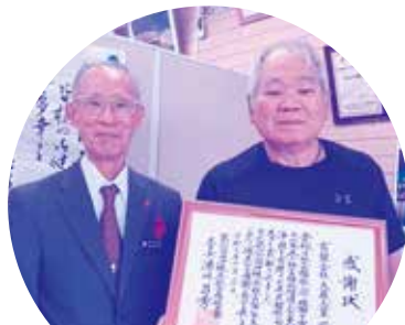
有限会社 大蔵工業

永年にわたり共同募金運動に率先して協力され、社会福祉の発展に貢献され受賞されました。