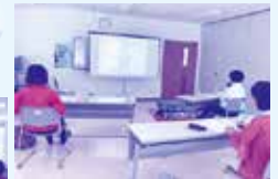
主任児童委員研修