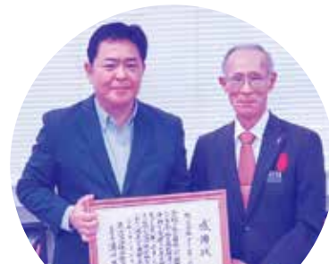
株式会社 アイムホーム

日頃から社会福祉に深い理解を寄せ、北谷町社会福祉協議会へ多額の浄財を寄附、社会福祉の増進に大きく貢献し、受賞されました。