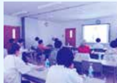
中堅民生委員児童委員 研修

北谷町民生委員児童委員は、コロナ渦の状況でも高齢者や気になる世帯への友愛訪問、社協と連携して高齢者世帯への弁当配布、ひとり親世帯や必要な世帯の調査(証明事務)など活動を実施しています。10月はDVD講習会を開催し、資質向上にも努めました。