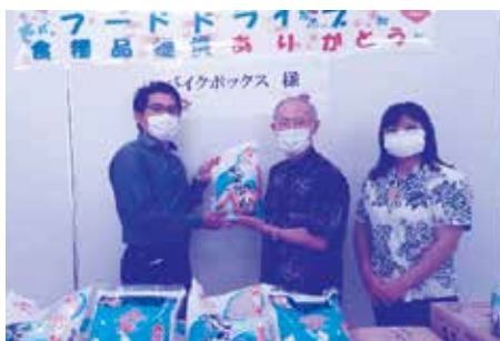
バイクボックス 様【浦添市在】

事業所や団体から沢山のフードバンクの支援がとどきました。 ありがとうございます。