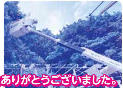
消防団のみなさまご協力ありがとうございました。