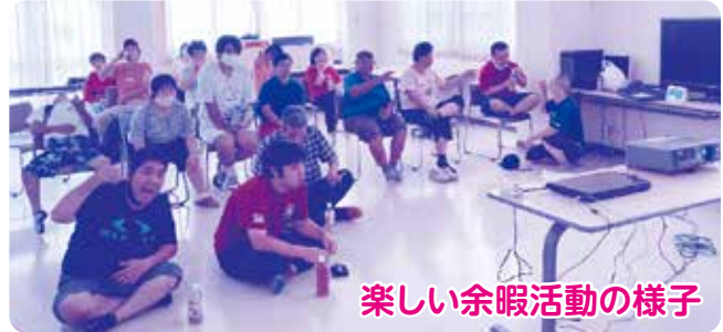
楽しい余暇活動の様子