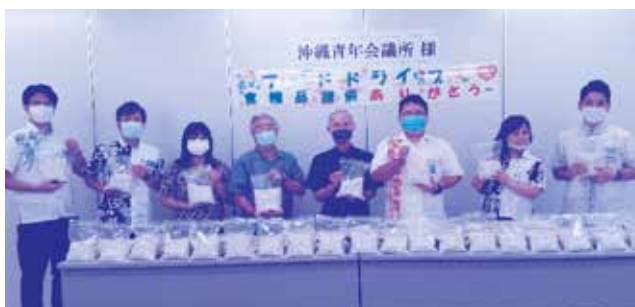
公益社団法人 日本青年会議所 沖縄地区協議会 様