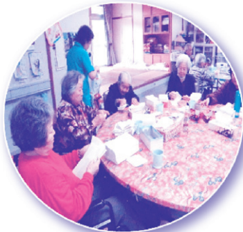
ティッシュペーパーたたみ

日頃のデイサービスでの活動の様子です。おはじき移しやキャップ外し等は手指の訓練を目的に実施されています。利用者様同士で協力し、ティッシュペーパーたたみや野菜の仕分け作業を実施しています。皆さん仲が良く楽しい雰囲気の様子です。