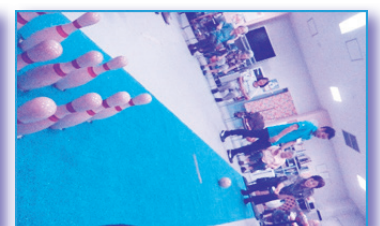
目指すはストライク