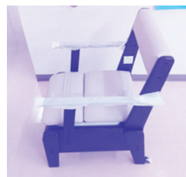
ポータブルトイレ