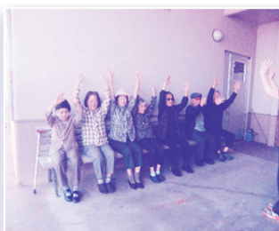
皆で楽しく体操の様子