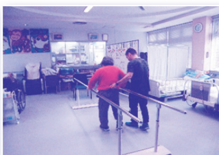
平行棒運動で下肢筋力UP