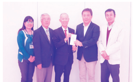
株式会社アイムホーム様よりご寄附 令和2年1月22日に株式会社アイムホーム様から町社会福祉 協議会へ50万円のご寄附をいただきました。