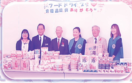
ライオンズクラブ国際協力337-D地区沖縄R1Z 様