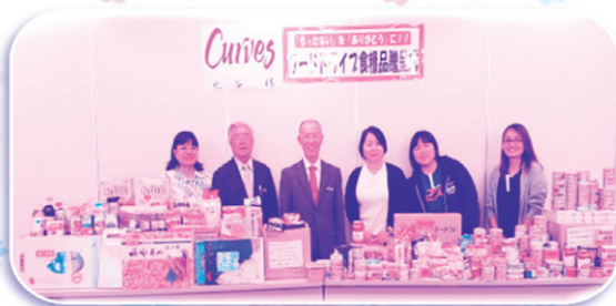
カーブス 北谷 様