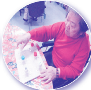
手指訓練 キャップ外し