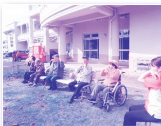
園庭でのガンジュー体操