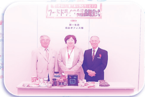
第一生命 北谷オフィス 様