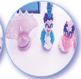
利用者様が作成した作品です