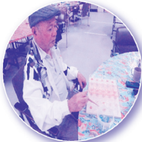
手指訓練 おはじき移し