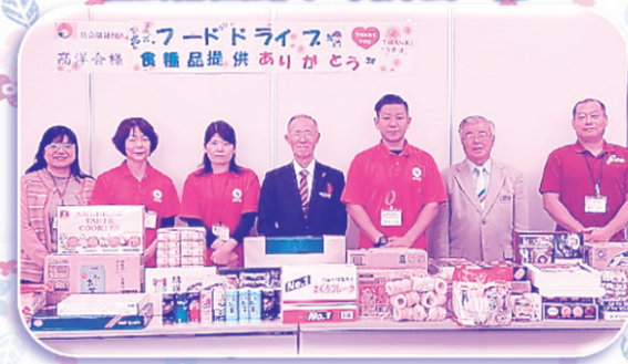
社会福祉法人 高洋会 様