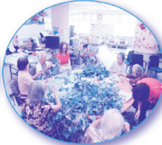
野菜の収穫& 仕分け作業〜

日頃のデイサービスでの活動の様子です。おはじき移しやキャップ外し等は手指の訓練を目的に実施されています。利用者様同士で協力し、ティッシュペーパーたたみや野菜の仕分け作業を実施しています。皆さん仲が良く楽しい雰囲気の様子です。