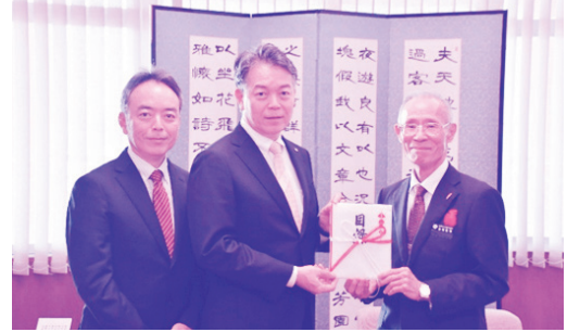
株式会社 北谷スポーツセンター様よりご寄附 令和元年12月12日に株式会社北谷スポーツセンター様から 町社会福祉協議会へ50万円のご寄附をいただきました。

ご芳志、誠にありがとうございます。 町内の社会福祉事業の推進の為、有効に活用させて頂きます。