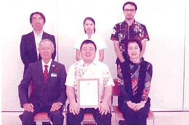
写真：「琉球治療院」の皆様と社協役員