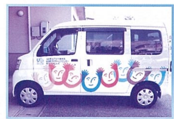
軽自動車(ハイゼット)

〜地域にとけこんだサービスを真心を込めて〜 一日無料体験できます。 936-3006