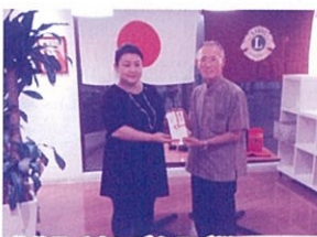
北谷ライオンズクラブ様より寄附