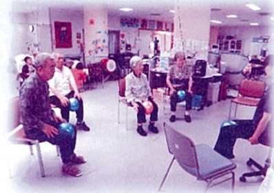
ボール運動・下肢運動 (尿漏れ予防訓練)