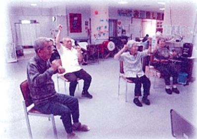
音楽に合わせて 柔軟体操

利用者さんも、機能訓練は身体機能の向上や転倒予防・防止になる為、積極的に参加しており曲を流しながらリズムに合わせて行う体操では笑顔が見られます。利用者さんからは「教わった訓練を家でもやっている。」「前は歩行後に息切れもあったが今では階段がスムーズに上がれるようになった。」との声も聞かれ意欲的な様子がかがわれます。