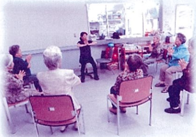
首、肩、腕の運動 (上肢運動)