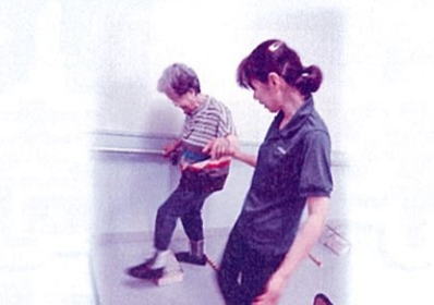
踏み台、棒を利用して 歩行訓練