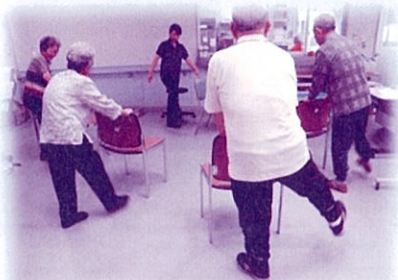
足の運動 (下肢運動)