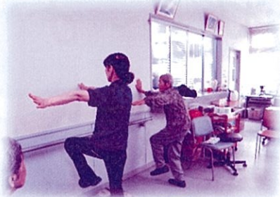
バランス運動 (転倒予防)