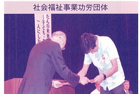
社会福祉事業功労団体