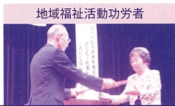
地域福祉活動功労者