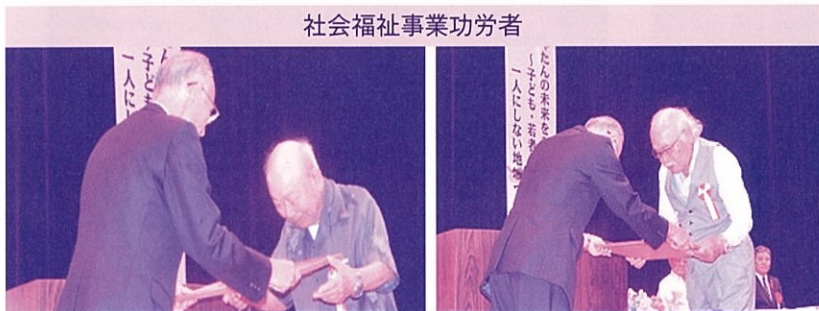
社会福祉事業功労者