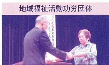
地域福祉活動功労団体