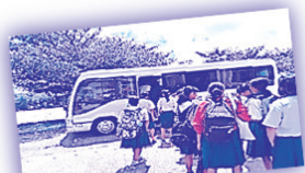
小中学校（校外学習）の移動に...