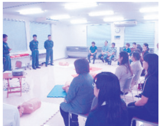
AEDも取り扱い法を学ぶと自信がつかます！