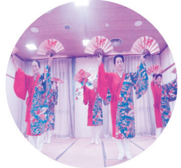
北谷町結舞踊結の会余興