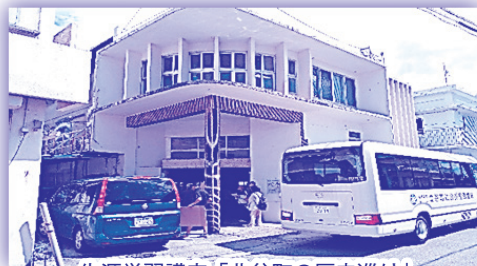
生涯学習講座「北谷町の歴史巡り」

●町内小中学校の校外学習、自治会の研修等で多く使用されている福祉バスの運行事業は、住民のみなさんから寄せられた会費や寄附金を活用しております。