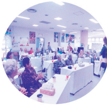
毎年敬老会は楽しみさ～