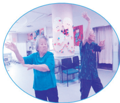
カチャーシーカチャーシー