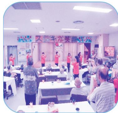
参加者で北谷音頭を披露