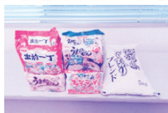
米5kg / 袋麺20食

北谷町にお住まいの方々3名様より食糧品のご寄附がありました。 困窮世帯の緊急的な支援に活用いたします。ありがとうございます。