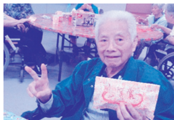
ゲームで 景品ゲット