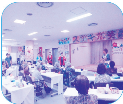
会の前の準備運動もイイネ～