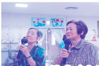
仲良くカラオケタイム

デイサービスでは日頃より、レク活動・カラオケタイムを通して利用者様同士交流を楽しまれています。皆さんステキな笑顔です。