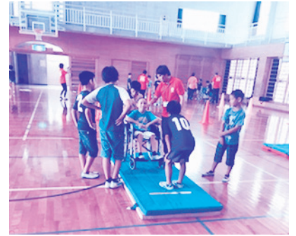
北谷小学校にて、社会福祉法人高洋会の協力のもと、車いす体験とアイマスク体験!