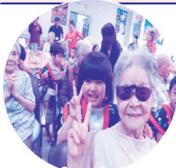
仲良くハイチーズ