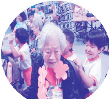
いつまでも元気でね