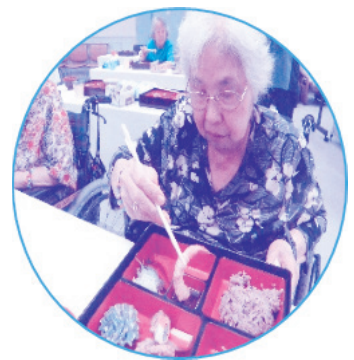
とっても美味しさ～