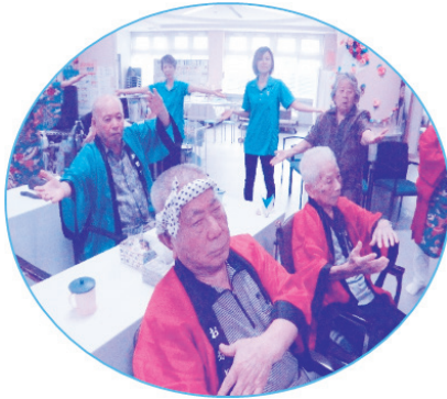
皆でイーヤーサッサー