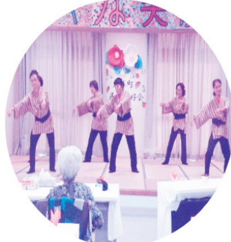
北谷町民踊愛好会余興