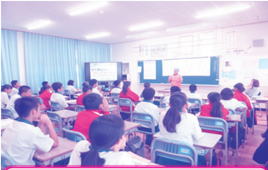
桑江中学校にて、手話サークル「青空の会」(ボランティア団体)による手話体験

北谷町社協では、思いやりの心を育て、子ども達が身近にボランティア活動や多くの人たちから「ともに生きる」ことを学び、「住み慣れた地域で誰もが安心して暮らせる福祉のまちづくり」を目的に福祉教育を町内学校で開催しています。