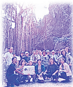
美浜区いずみの会 (ガンガラーの谷)