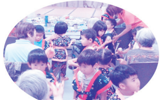
また遊びに来るね〜