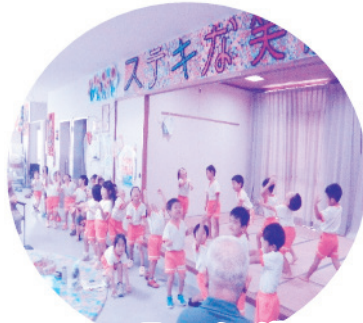
気合の入ったダンス