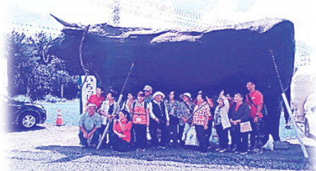
願寿大学研修（オキハム工場）にて