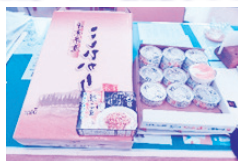
米5kg / 缶詰12個